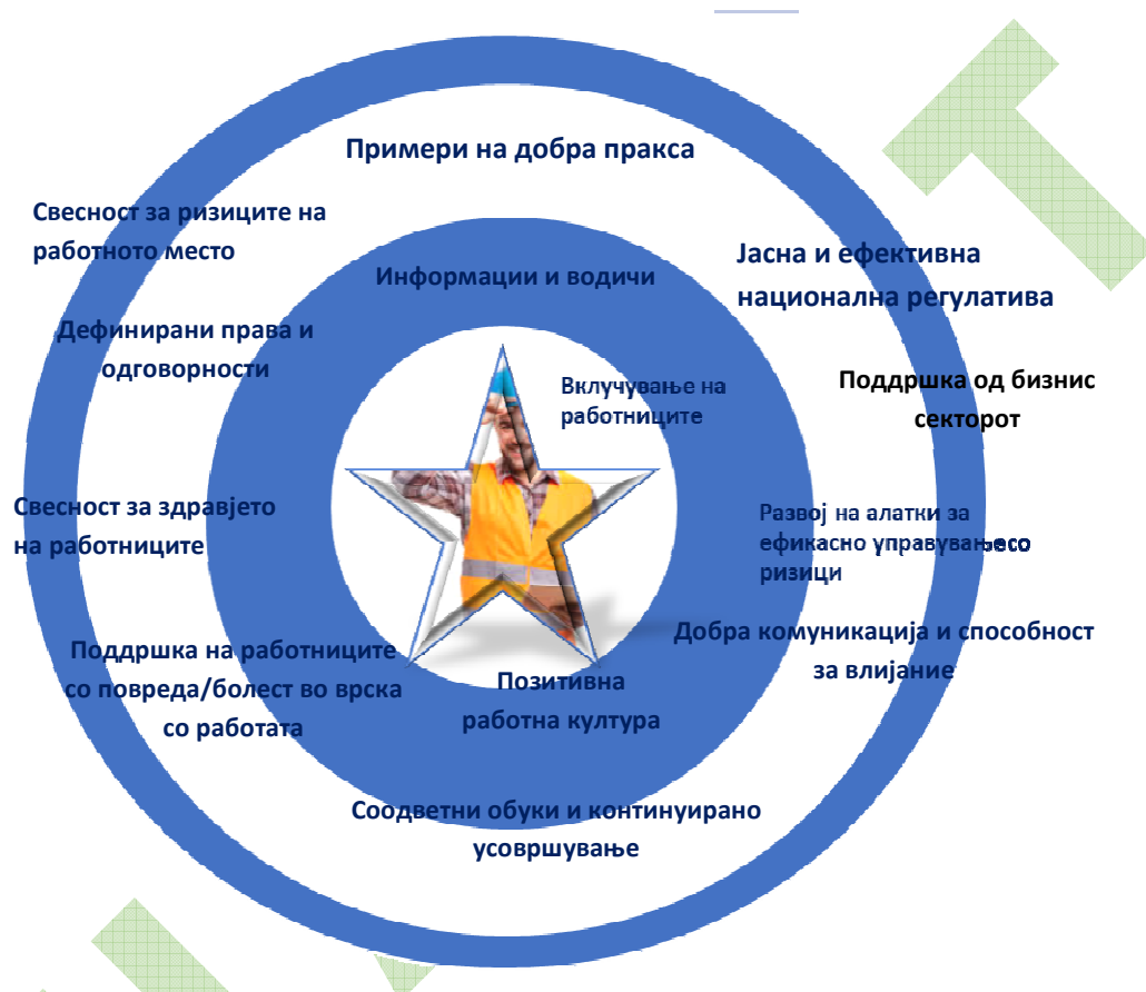
Сл.2.1 Пораки на Стратегијата за безбедност и здравје при работа 2021-2025 - Работникот во центарот на системите за БЗР -